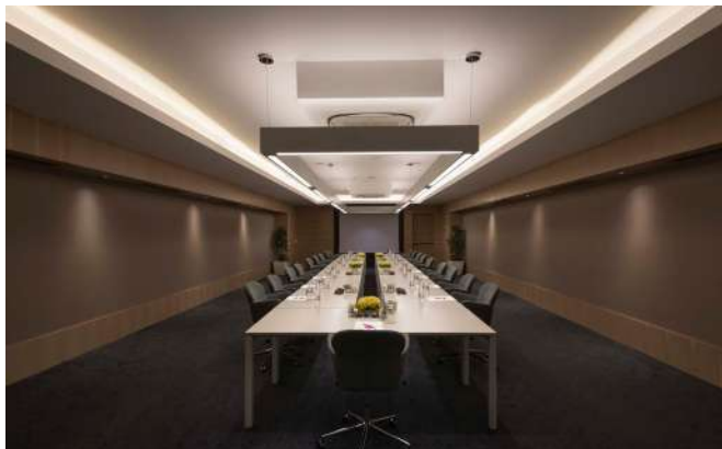
Зал "Cadianda" (110 М²)

В оборудованных по последнему слову техники конференц-залах отеля Akra Fethiye Tui Blue Sensatori, подходящих для рассадки различных форм, могут быть проведены собрания, конференции, деловые встречи и семинары любого уровня. Благодаря помощи профессиональной команды сотрудников отеля Akra Fethiye Tui Blue Sensatori и эксклюзивным привилегиям концепции Ultra AI, ваши мероприятия пройдут максимально эффективно и успешно.