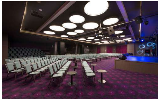
Show Lounge (550 М²)